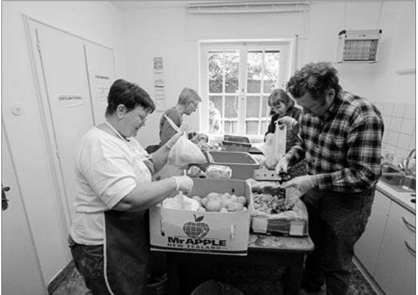
In vielen Orten engagieren sich ehrenamtliche Helfer, damit Bedürftige bei der Tafel Lebensmittel erhalten. Dabei darf nicht der Eindruck entstehen, dass von Armut belastete Menschen in Gettos der Bedürftigkeit weggeschickt werden.

Hannover zeigt. Dort hat ein Pfarrer gemeint, Innenstadtgemeinden seien generell überaltert. Also wurde ein super Seniorenprogramm aufgebaut. Das Gemeindehaus wurde faktisch zu einem Seniorenzentrum. Dann aber kam eine junge Gemeindeführerin und fragte den Pfarrer, warum hier eigentlich so viele Mütter mit Kinderwagen entlanggingen. Er sagte, dass sei die Kindertagesstätte oder sie kämen aus der Stadt und gingen nach Hause. Es wurde eine Gemeindeforschung gemacht und festgestellt, dass 50 Prozent der Gemeindeführer unter 35 Jahre alt sind. Die Verantwortlichen hatten nicht gemerkt, dass die Enkelgeneration wieder in die Innenstädte gezogen ist.