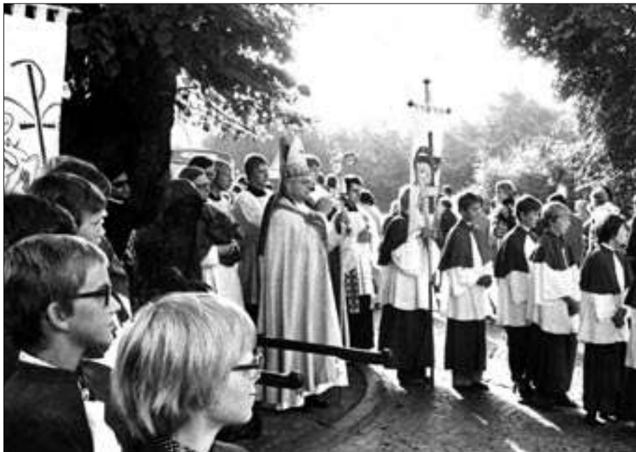
Der Besuch eines Bischofs – auf unserem Bild Heinrich Tenhumberg – brachte früher die ganze Pfarrfamilie, ja ein ganzes Dorf auf die Beine.