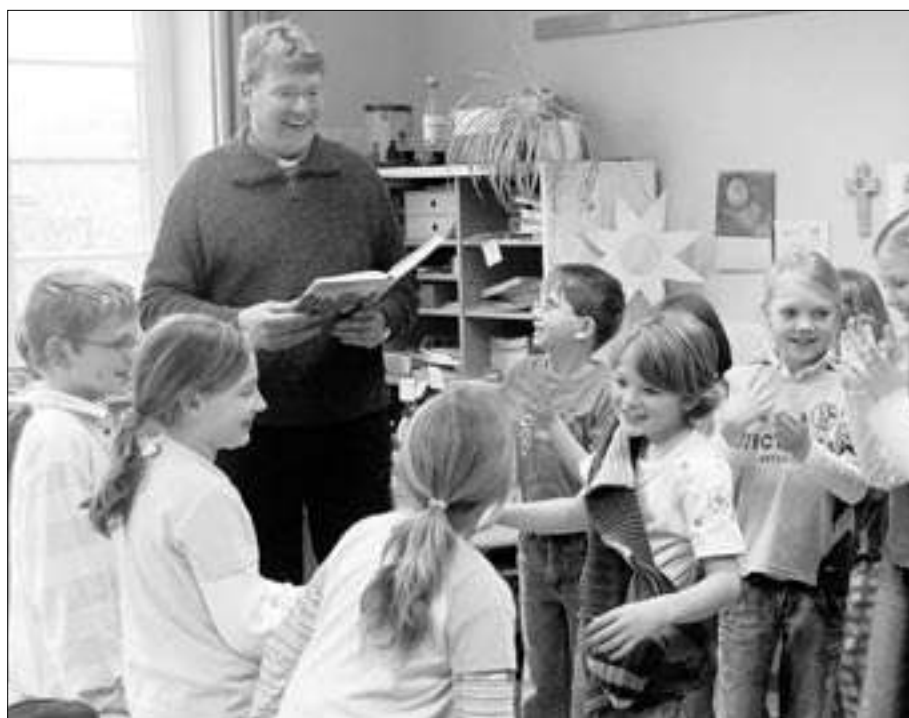
Weniger junge Priester bei wachsenden Herausforderungen der Weitergabe des Glaubens kennzeichnen die heutigen Rahmenbedingungen.

Bei den letzten Wahlen im Bistum Hildesheim konnten wir viele unserer Gremien nicht mehr satzungsgemäß bilden. Die Leute wollen nicht mehr. Der Deutsche Verein für öffentliche und private Fürsorge in Berlin hat 2005 (Jahr des Ehrenamtes) ermittelt, wie das typische Bild des deutschen Ehrenamtlichen aussieht. Während in den Kirchen die meisten Ehrenamtlichen weiblich, über 60 Jahre alt und in der nachfamiliären Phase sind, beschreibt der Deutsche Verein den typischen Ehrenamtlichen als weiblich, zwischen 30 und 40 Jahre, verheiratet, berufstätig und mit zwei Kindern. Wo sind diese Menschen, diese Frauen in unseren kirchlichen Zusammenhängen? Ohne Frage läuft hier etwas falsch. Frauen in dieser Lebenssituation sind super organisiert. Sie würden auch noch vier Stunden zusätzlich ehrenamtlich arbeiten. Die schaffen das in der Regel sogar mit viel Kraft. Solche Charis-