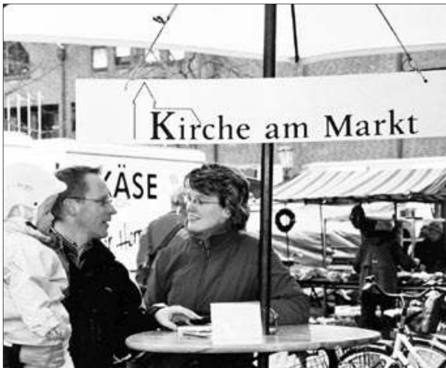
Kirche muss dort präsent sein, wo sich Menschen treffen: Geht hinaus in alle Milieu-Welten.

Dem Leitgedanken folgend, dass die Pfarrei eine „Gemeinschaft von Gemeinden“ ist, wird die Kirche nicht konzentrisch, sondern als ein vielfältiges Netzwerk verstanden. In einem Netzwerk sehr unterschiedlicher pastoraler Orte bilden die Orte der Diakonie, die Kirchen als Bauwerke, die Schule, die Kategorialpastoral keine hierarchische monolithische, sondern eine plurale vernetzte Struktur. Wer an einen dieser Knotenpunkte hinkommt, erhält sehr schnell einen Hinweis darauf, wo er das, was er sucht, in diesem Netzwerk bekommt. Denkt man die Kirche vor Ort als ein Netzwerk von Beziehungen, dann ist beispielsweise auch der Kindergarten ein pastoraler Knotenpunkt, um den herum sich Beziehungen strukturieren. Um den Kindergarten versammeln sich etwa junge Familien, die nicht unbedingt in den Sonntagmorgen-Gottesdienst kommen, die aber bereit sind, sich um ihrer Kinder willen zu engagieren. Sie gestalten beispielsweise eine Andacht im Kindergarten und kommen dabei mit dem Evangelium in Berührung. Die Erfahrung zeigt, wenn die Beziehungen, die man erlebt, positiv sind, dann sind sie das