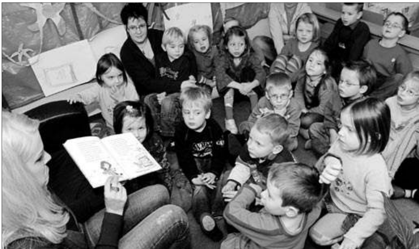
Lebendige Gemeinde findet an unterschiedlichen Orten statt.

Die Pluralität der modernen Gesellschaft zeigt sich auch in der Ungleichzeitigkeit und Parallelität unterschiedlicher Gemeindekulturen. Kirchliches Leben auf dem Land unterscheidet sich drastisch von dem in der Stadt. Der Umbau, so scheint es, wird für die Kirche in der modernen Gesellschaft zur Daueraufgabe. Unter heutigen Bedingungen muss sich die Gemein-