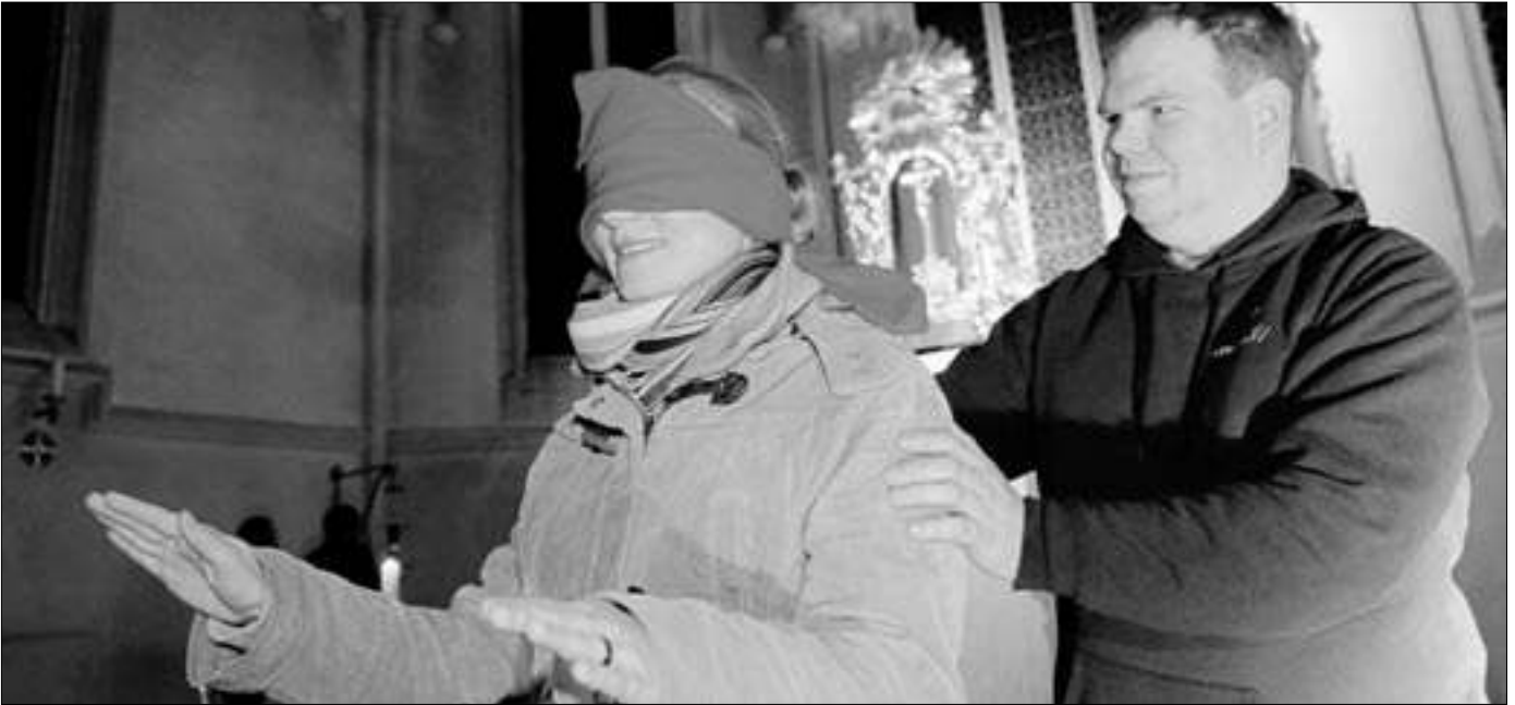
Das Leben in der kirchlichen Gemeinschaft entwickelt sich neu, territoriale Strukturen werden aufgebrochen – wie in der Jugendkirche „effata“

Entwicklung ein. Die Gemeinden und Christen an den Kapellenstandorten verstanden sich nicht länger als zu versorgendes Pastoralvolk, sondern als aktive Gemeinde, die selbst Kirche vor Ort bildet, die selbst Verantwortung für das Glaubensleben übernimmt, die miteinander Kirche ist und die Grundvollzüge von Kirche lebt. Wie war das möglich?