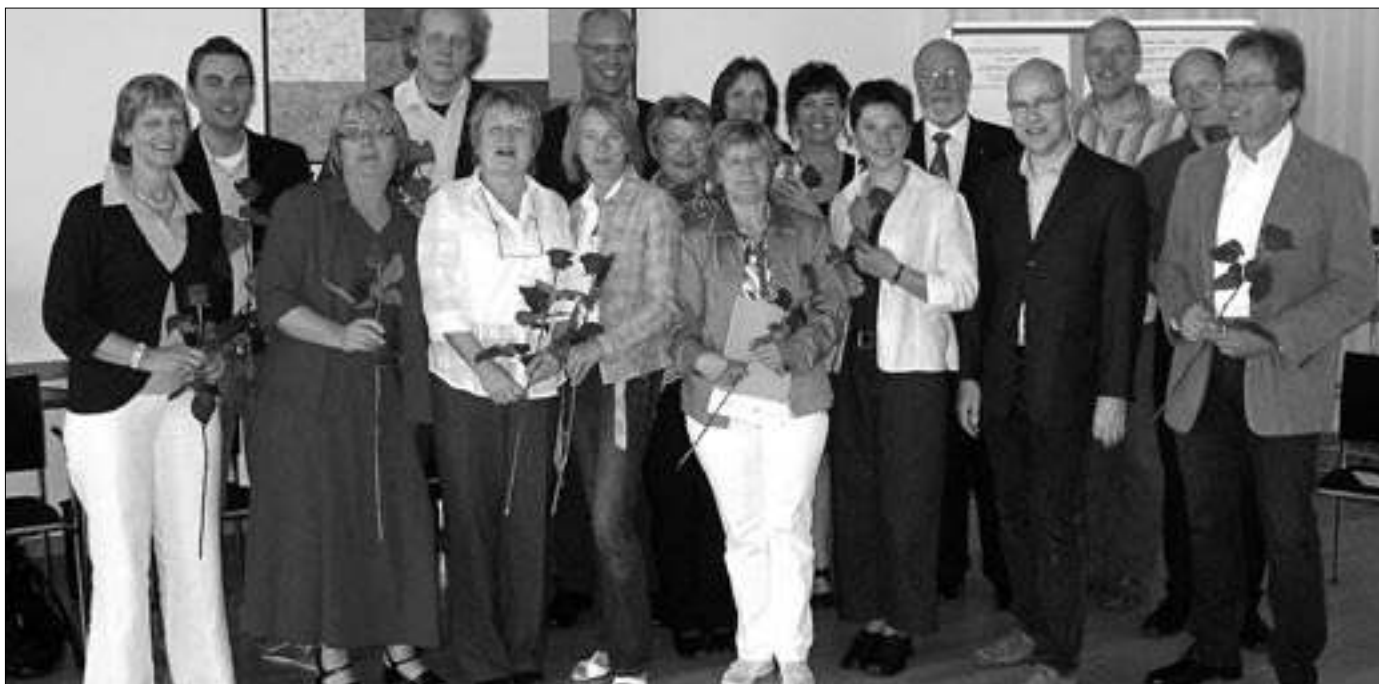
Von August 2009 bis Mai 2010 bot das Referat Behindertenseelsorge im Rahmen eines Pilotprojekts erstmals eine Ausbildung für „Begleiter in der Seelsorge für Menschen mit Behinderungen“ an. Nach dem erfolgreichen Abschluss der Ausbildung erhielten die Teilnehmer ihr Zertifikat und ihre kirchliche Beauftragung.

kirchliche Einstellung kann nicht mehr wie bei Ordensleuten stillschweigend unterstellt werden. Die kirchliche „Großwetterlage“ hat sich auch dahingehend rapide verändert, dass der größte Teil der Mitarbeiter (wie auch in den Pfarrgemeinden) keine Beziehung zum Leben in der Kirche haben. Ein hoher kirchlicher Würdenträger und Funktionär des Deutschen Caritasverbandes zog daraus die Schlussfolgerung, dass kirchliche Sozialeinrichtungen „Lernorte des Glaubens“ für die Mitarbeiter sein müssten. Offen bleibt dabei zurzeit noch die Frage, von wem denn der Glaube zu lernen sei – zumal in den meisten Einrichtungen hauptamtliche Seelsorger (erst recht Priester) fehlen.