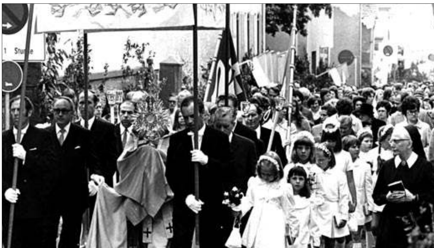
Auch die Beteiligung an Fronleichnamsprozessionen – hier ein undatiertes Archivbild – hat nachgelassen.

Auch wenn im Alltag die Begriffe „Gemeinde“, „Pfarr-“ oder auch „Kirchengemeinde“ häufig synonym benutzt werden, handelt es sich bei