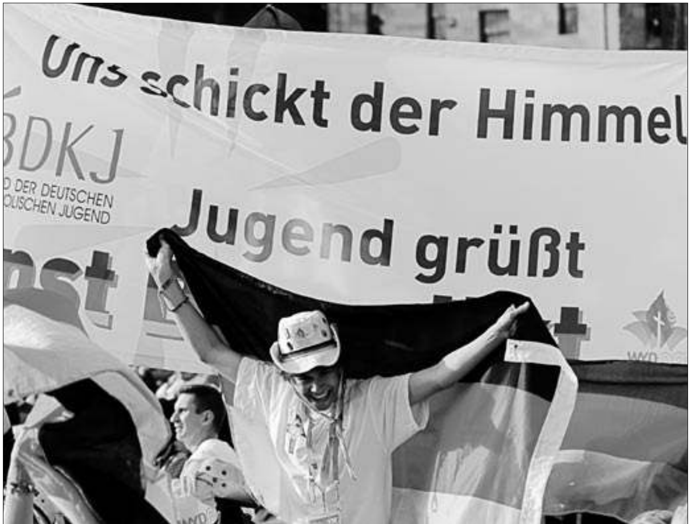
Kirchliche Gemeinschaft positiv erlebt: Bilder wie hier vom Weltjugendtag haben motivierenden Charakter.

an dem es angefangen hat. Auch wenn die Jünger dann in die oben erwähnte Falle tappen, einfach das Alte wieder aufzunehmen, zeigt diese Rückkehr an den See nicht nur Resignation, sondern