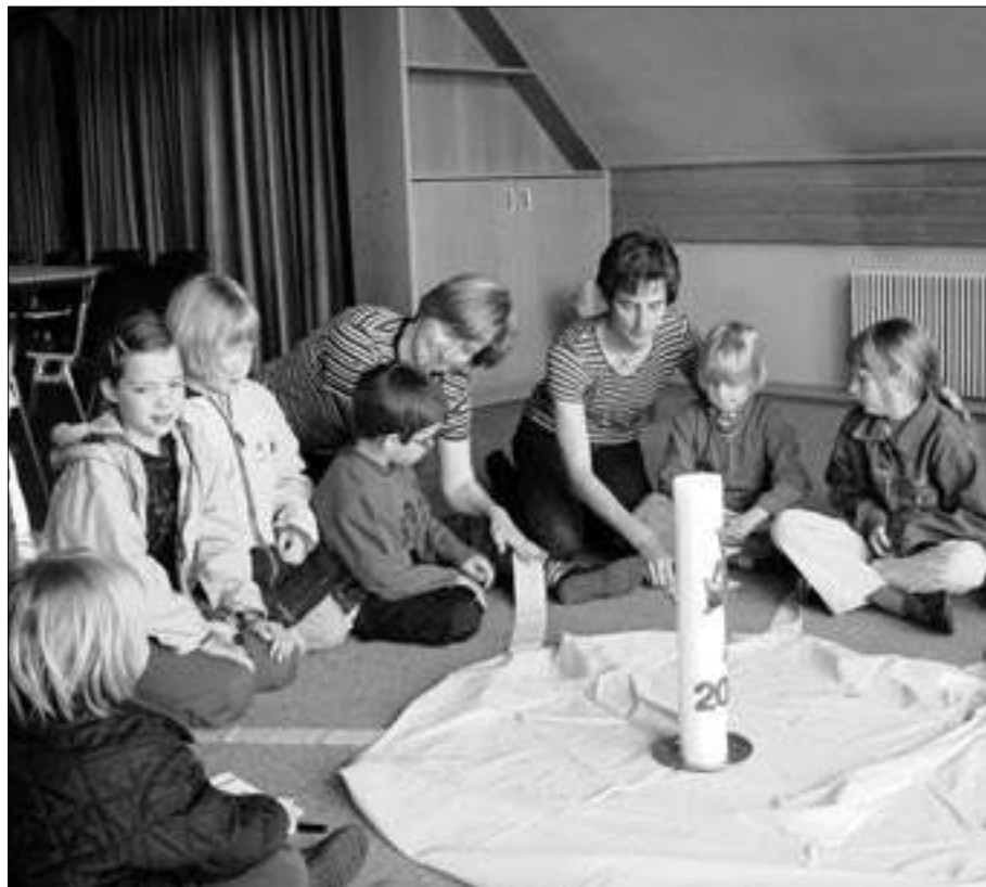
Wo man sich versammelt, erlebt man sich als Gemeinschaft.

Für diesen gemeindebezogenen Ansatz gibt es gute theologische Argumente. Es ist die Ekklesiologie des II. Vatikanischen Konzils. Dieses hat das Kirchenverständnis fundamental erneuert. Fundamental bedeutet: Es hat auf eine Sicht der Kirche zurückgegriffen, wie