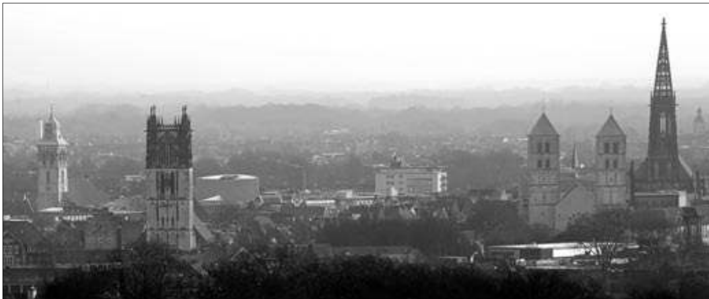
Auch im Bistum Münster – hier die Bischofsstadt – werden die pastoralen Räume größer.

muss nicht erst die Gemeinschaft da sein, um miteinander zu beten und in der Bibel zu lesen, sondern umgekehrt.